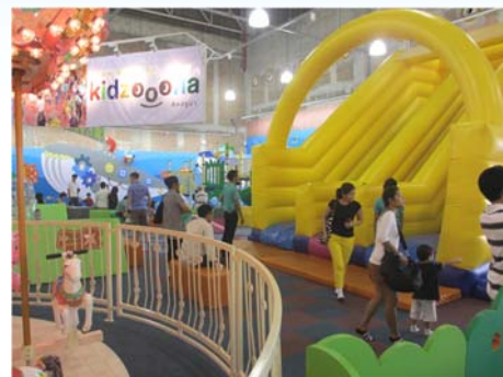
<ザモール・ナムウォンワン店>

「Mollyfantasy」業態と「Kidzooona」業態の併設店舗を展開し、人気を博している。