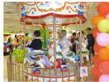
＜莫莉幻想惠阳永旺店＞