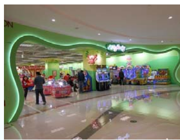
＜莫莉幻想北京金隅万科城店＞