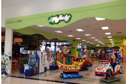
<モーリーファンタジーサマーモール店>