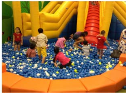
<モーリーファンタジータンフーセラドン店>

2014年1月11日にホーチミン市「イオンモール タンフーセラドン」内にFC第1号店をオープン！