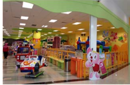
<モーリーファンタジーシティーワン店>