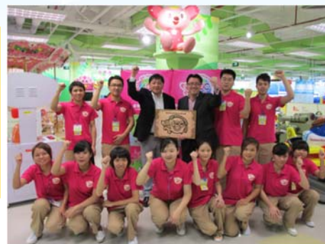
＜莫莉幻想中山興中広場店＞

今期25店舗の新規出店。 「モーリーファンタジー中山興中広場店」の 出店時点について世界で400店舗を達成！