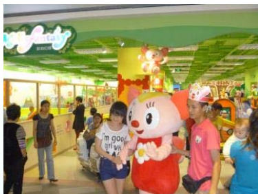
＜莫莉幻想深圳绿景佐岭香颂店＞