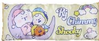
RJ SHOOKY CHIMMY