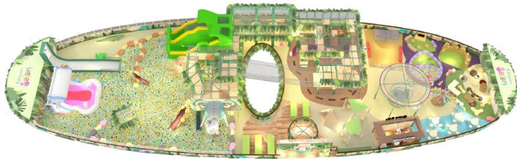
Kidzooona Safari イメージ図

「Kidzooona Safari」は「大自然を旅する冒険」をテーマに、約1,200㎡の広大な面積の中に自然をモチーフにした様々な遊びを導入いたしました。また、高さ22mの建物空間の中に、高さ9mもある立体遊具を導入。まるで本物のジャングルで遊んでいるかのような気分を味わえる新感覚のインドアプレイグラウンド施設です。