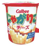
じゃがりこリュック チーズ