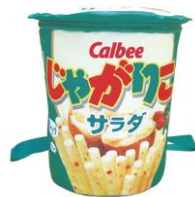
じゃがりこリュック サラダ