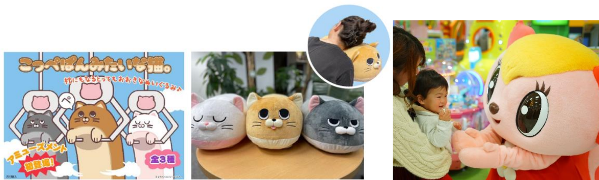
画像左：イオンファンタジー主催「モーリーオンライン × いちあっぴ プライズ化コンテスト」で商品化されたキャラクター「こっぺはんみたいな猫。」

新たなキャラクターを世に送り出すことで、より多くの人々へ“えがお”をお届けすることを目指します。さらに、キャラクターを通してイラストレーターを目指すこともたちの夢を育み、未来のクリエイター育成に挑戦します。