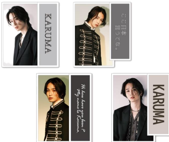
E 賞 ステッカーセット 全4種