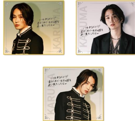
D 賞 レプリカメッセージ入り色紙 全3種