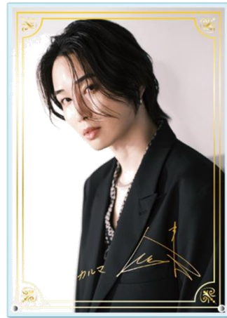
B 賞 箔押しアクリルボード 全1種