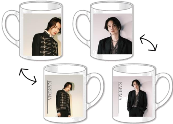
C 賞 マグカップ 全2種