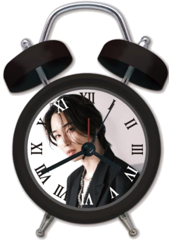
A 賞 ボイス入り目覚まし時計 全1種