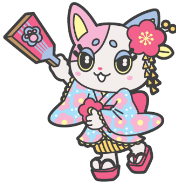
流行りの KAWAII ならおまかせ 小梅