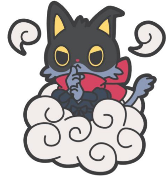
繰り出す忍術は江戸っ子一 影