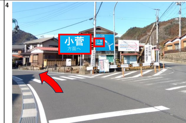
ウエルシア様を過ぎてから600m程走った先の分かれ道を 左へお願いします。