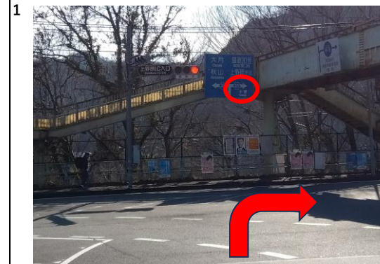
中央道上野原ICの料金所出口を出て信号を右折して下さい。 このあとも小菅方面を目指してお越してください。

Appleマップ(iphoneにインストール済みのマップ) またはYahoo関連マップで検索された場合、 「モーリーファンタジーミューの森」と表示され、 違う場所へ案内される場合がございます。 カーナビで「ミューの森」または、 旧施設名の「ゆずりはら青少年自然の里」で検索いただくか Google mapで「ミューの森」と検索し、お越してください。