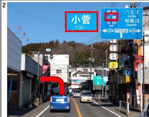
つきあたりの信号を左折して下さい。 ここから国道20号線となります。