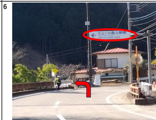
3kmほど山道を進むと「ミューの森上野原」の 看板を左折ください。 ※狭い道となっていますのでご注意ください