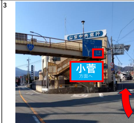
山梨中央銀行前の分かれ道を右へ曲がってください。 ここから県道33号線となります。