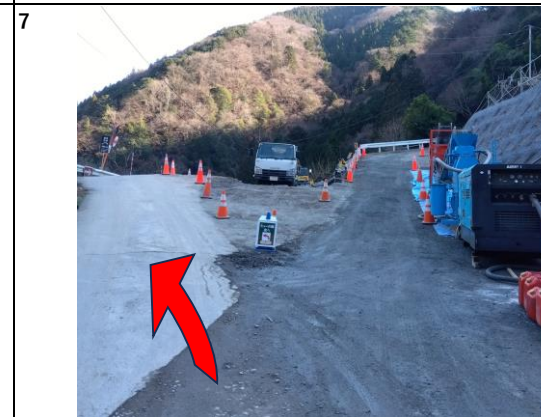
橋を渡ると分かれ道を左に進んでください。 ※ジェットコースターのような急坂です。徐行お願いします。