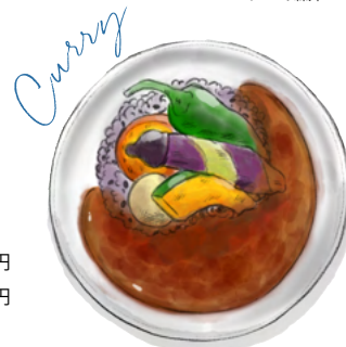
季節の焼き野菜とカレー

黄卵 ローストビーフ ブロッコリー ポテトサラダ ハンバーグ キーマカレー ライス サラダ