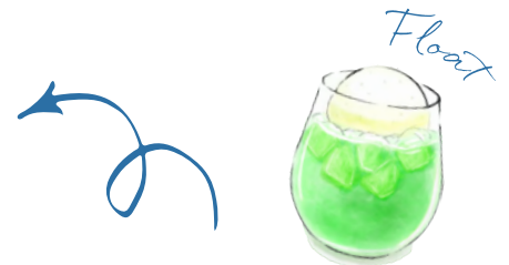
メロンソーダフロート