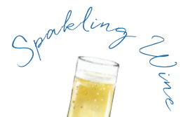
日本のあわ 甲州シャルドネ