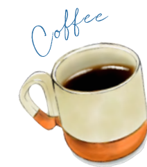
ミューの森 オリジナルブレンドコーヒー