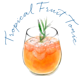
トロピカルフルーツトニック