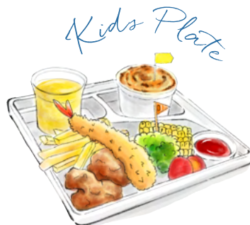
ミートドリアとフリット 季節の野菜添え