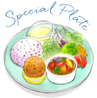
お野菜とメンチカツ 牛肉煮込み