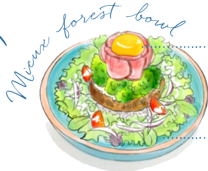
ミューの森丼 ローストビーフとハンバーグ

デザート 卵、乳、小麦 ・金の芋とアイスクリーム 650円 ・季節のシャーベット 350円 ・バニラアイス 400円 ・大人の黒蜜バニラアイス (※アルコール入り) 500円