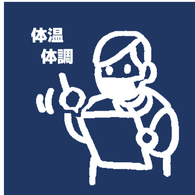
全従業員の健康チェックの実施・記録