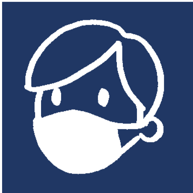
全従業員のマスク着用