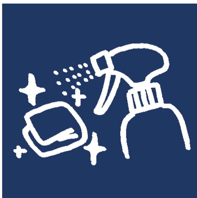
館内のアルコール清掃の実施