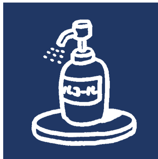
入館時のアルコール手消毒 各所アルコール消毒液の設置