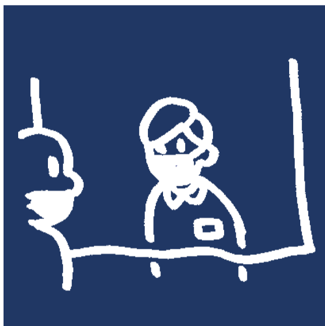
フロントのビニールカーテンの設置