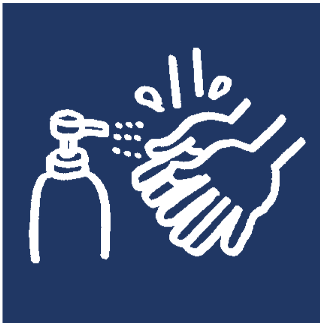
従業員の手洗い・アルコール消毒