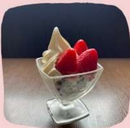
いちごミニパフェ