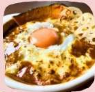
焼きチーズカレー