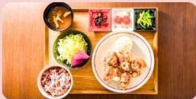
ピリ辛ネギだれ竜田揚げ定食