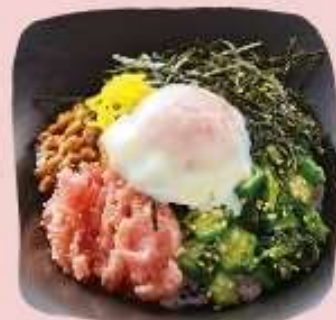
まぐろねばとろどん