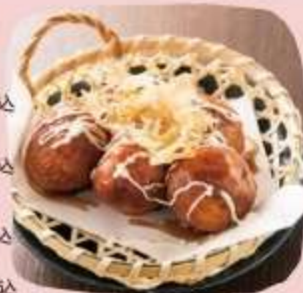
銀だこ監製 たこ焼き