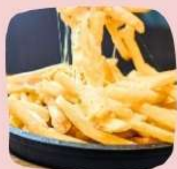
鉄板チーズポテト