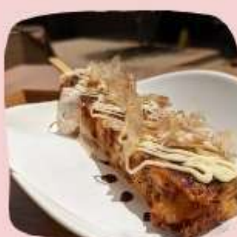
お好み焼き焼き串