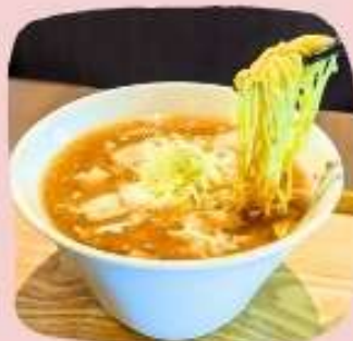
麻婆豆腐ラーメン