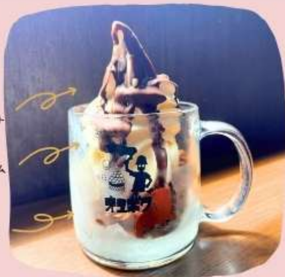
ジョッキパフェ・チョコ