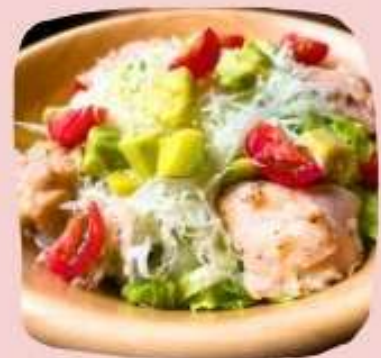
グリルチキン&アボカド