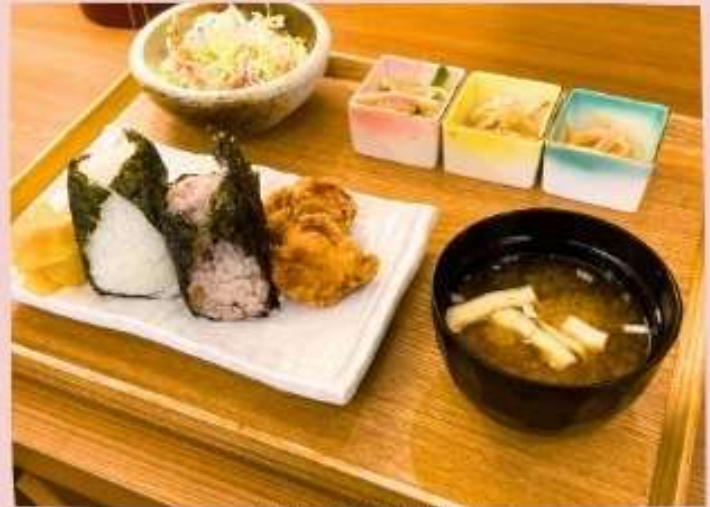
厳選国産米おにぎり定食