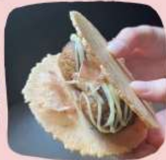
たこやきせんべい(大阪名物)