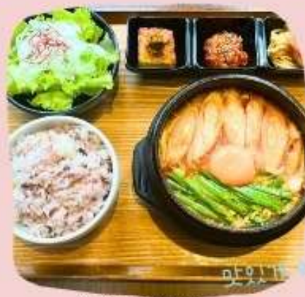
スンドゥブセット