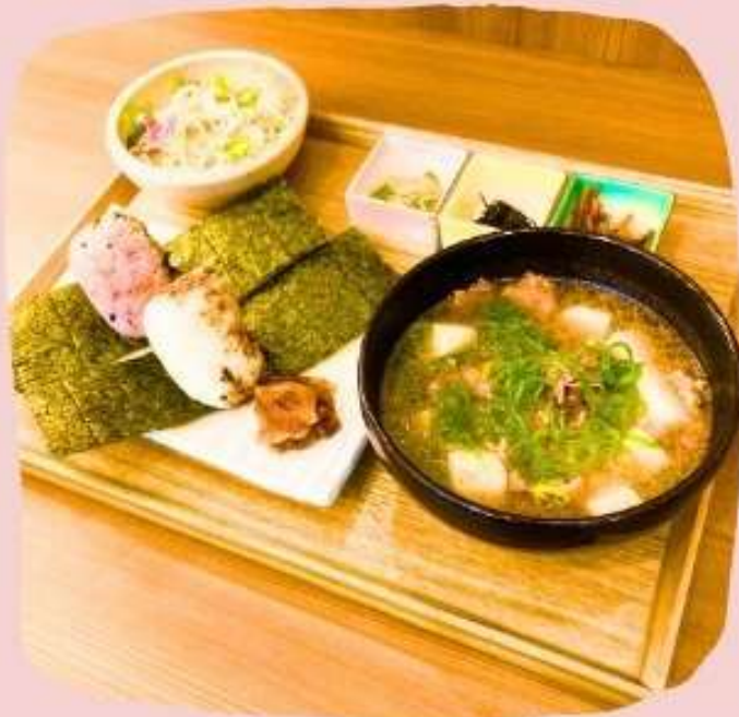
肉すいおにぎり定食