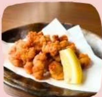
コリコリ軟骨のからあげ