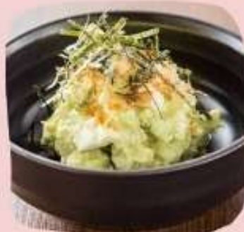
アボカドクリームチーズ