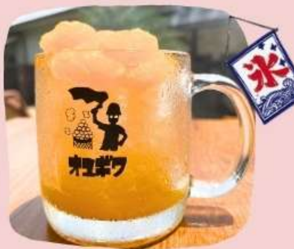
みかんかき氷 (ソフト入り)